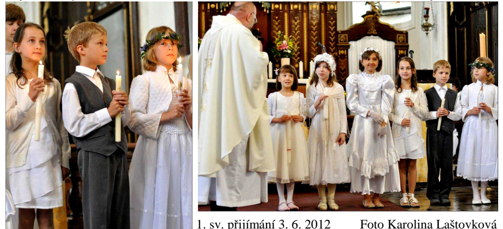
1. sv. přijímání 3. 6. 2012

Kardinál George není zdaleka jediný z amerických biskupů, kteří bijí na poplach. Uvedený návrh zákona o zdravotní péči intenzivně kritizoval také dvaadesátiletý kardinál a newyorský arcibiskup Timothy Dolan, který se nedávno s počtem 42 000 hlasů umístil na jednom z předních míst v čtenářském hlasování „Osobnost roku 2012“ amerického magazínu Time. Svoji důvěru Mons. Dolanovi projevili už v roce 2010 američtí biskupové, kteří ho zvolili předsedou biskupské konference. Newyorský arcibiskup si také v nedávné době najal osobního trenéra a podařilo se mu zhubnout o 25 kilogramů. Je to jiná země, trochu jiná církevní mentalita – ale překvapivě podobné problémy jako u nás... Ať už jde o nutnost hájit své názory a postoje nebo o potřebu hlídat si nadváhu... -jm-