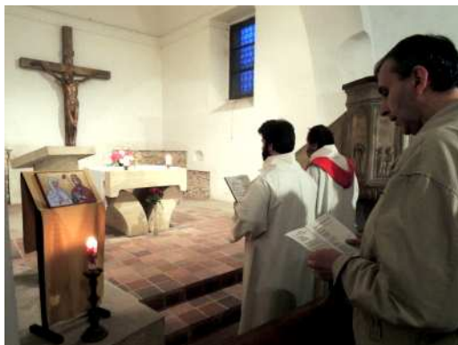
Svatováclavská slavnost na Budči 2012

Historicky je doloženo až to, že tu po r. 895 nechat kníže Spytihněv postavit rotundu sv. Petra. O dost později bylo svatopetrské zasvěcení rozšířeno i na sv. Pavla. Románská rotunda sv. Petra a Pavla je nejstarší dosud stojící stavbou v Čechách. A do ní bychom se rádi podívali a slavili v ní či v její bezprostřední blízkosti eucharistii, pokud to jen bude možné. Hlavní chrámová loď Spytihněvovy stavby přestála všechny pozdější úpravy z 16. a 17. století bez úhony.